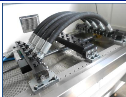
Camera di test con tubi in configurazione di prova